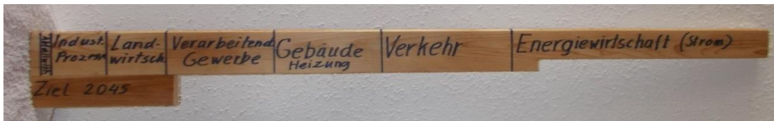
Abb.: Ausstoß von Treibhausgasen in Deutschland nach Quellen im Jahr 2015 und das erforderliche Ziel

Mit dem unten abgebildeten Modell wird die Situation maßstäblich dargestellt. Die Gesamtlänge des Bretts entspricht dem Ausstoß von Treibhausgasen im Jahr 2015, es waren (wie auch im Jahr 2017) 903 Mill. Tonnen äq. CO 2 . Unten links ist das Ziel dargestellt, das wir bis 2045 erreichen müssen, wenn wir unseren Beitrag für das in Paris beschlossene Ziel leisten wollen.